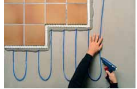
Kabel T2Blue o výkonu 5W na běžný metr je novinka výhodná především pro nízkoenergetické a pasivní domy (RAYCHEM)

Ani výrobci plynových kotlů nezaostávají. Důkazem je nová řada plynových kondenzačních kotlů Baxi Luna Platinum a Luna Duo-tec. Think Intelligence Within – „mozek uvnitř kotle“ zajišťuje to, že kotel flexibilně komunikuje se všemi technologiemi vytápění a vytváří tak komplexnější a energeticky účinnější řešení. Jeho velkou devízou je obrovský rozsah modulace výkonu 1:10, který výrazně zvyšuje účinnost kotle a možnosti úspor. V praxi to znamená, že výkon kotle lze přizpůsobit skutečným tepelným ztrátám budovy a zabránit tak zbytečnému