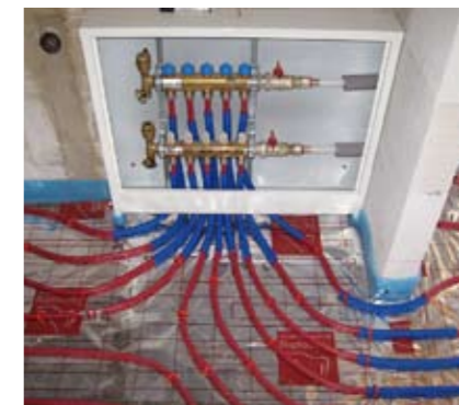
Rozdělovací stanice a skříň pro podlahové topení. Zde se sbíhají a napojují všechny jednotlivé okruhy podlahového topení (REHAU)

můžeme fyzicky zvednout tloušťku podlahy, ale i snadná a rychlá montáž. Rohože se ukládají těsně pod dlažbu nebo jiný typ vhodné krytiny a právě malá krycí vrstva umožňuje snadnou regulaci a rychlé změny teplot. To je a bylo u podlahového topení velmi citlivý problém. Dnešní programově řízené regulátory s čidlem v podlaze jsou například vybavené inteligentní adaptivní funkcí optimalizují spotřebu elektrické energie a umožňují velmi komfortní provoz. Tyto řídicí systémy dokáží reagovat na změny teploty v místnosti i na změny venkovní teploty, podle kterých regulují výkon, mají dálkové časovače a mnoho jiných vymožeností. Další vychytávkou, kterou ocení především lidé často cestující nebo ti, kteří si pořídí podlahové topení na chalupu, je možnost dálkového ovládní pomocí mobilu. Stačí poslat sms a topení se vám v určitou dobu zapne či vypne. Pomocí mobilu můžete ještě dostat i informaci o momentální teplotě v místnosti. ■